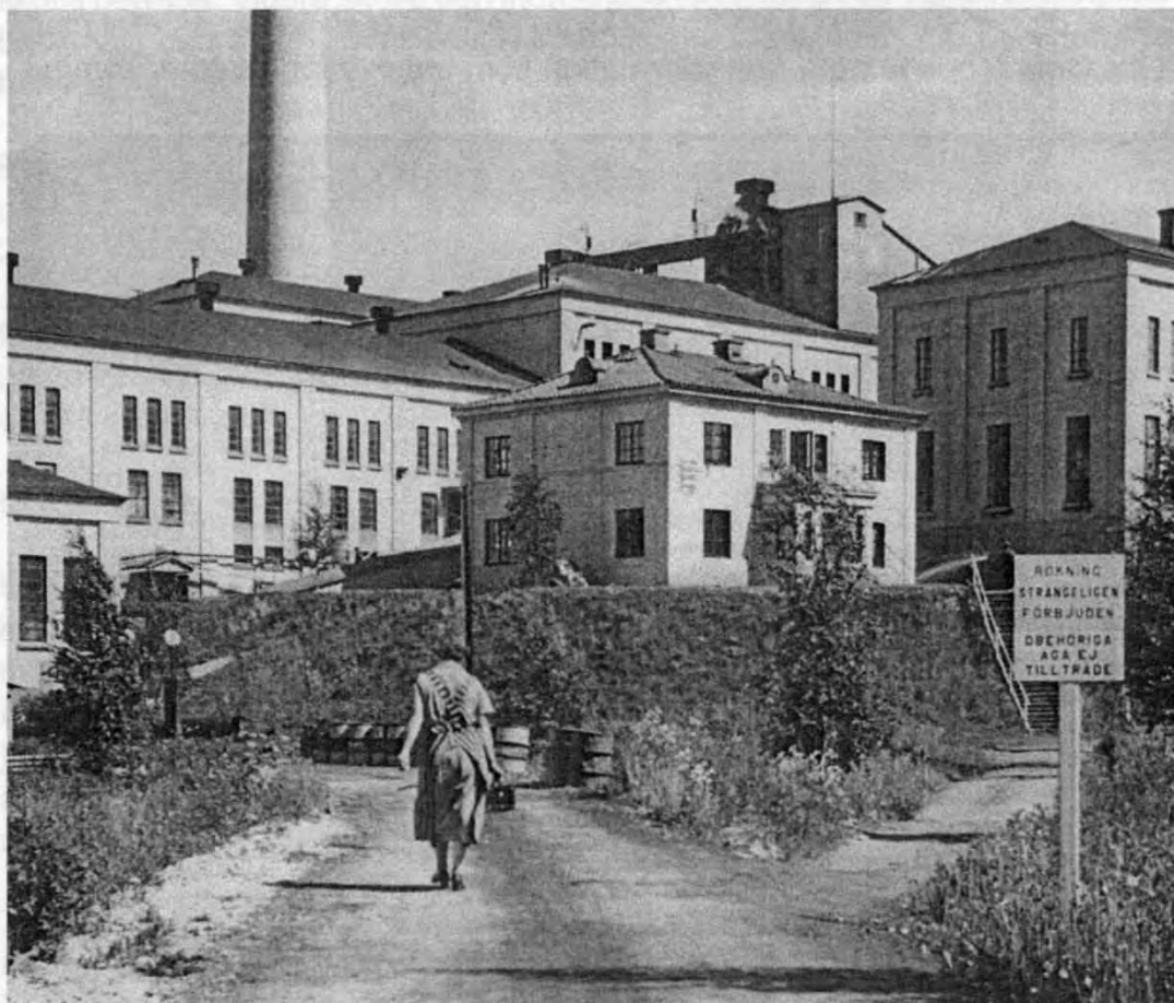
Sandvikens Sulfatfabrik 1927. Kvinde med madspand til ægtefælle

Även i ett så pass koncentrerat material som bolagens styrelseprotokoll - här rör det sig om hylldecimeter - är det mesta ointressant för mitt ändamål. Också här gäller det alltså att ha skyggglapparna fast monterade om jag skall bli färdig nångång.