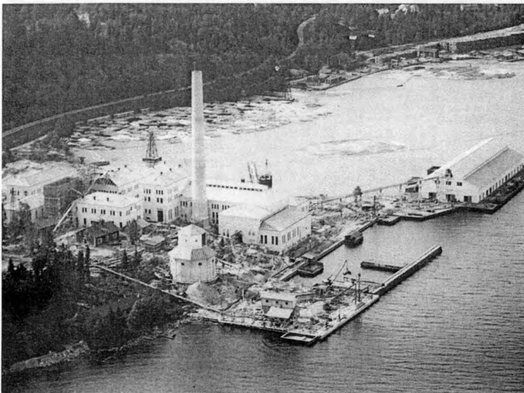
Sandvikens Sulfatfabrik (1928-1979) under opbygning 1927

Så är vi då framme vid uppgiftens verkliga pièce de résistance , arbetet med att för varje fabrik ta fram den information som behövs för att åstadkomma