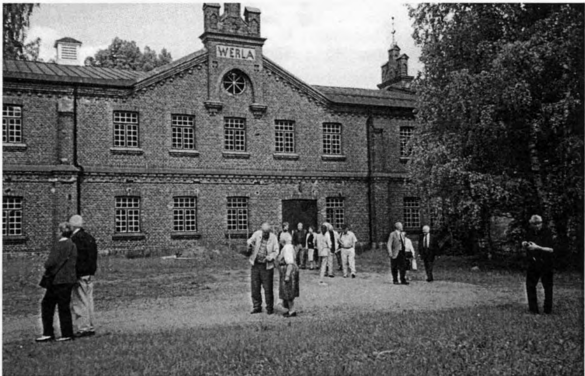
Verla Fabriksmuseum juni 2001

Utgiven av Föreningen Nordiska Pappershistoriker