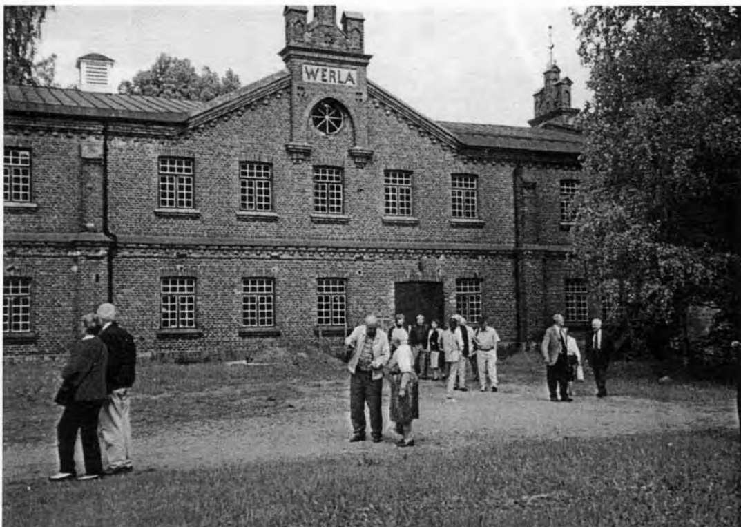
Fra Verla Fabriksmuseum

Lørdagen havde to udflugtsmål: Verla fabriksmuseet og galleriet for papir-