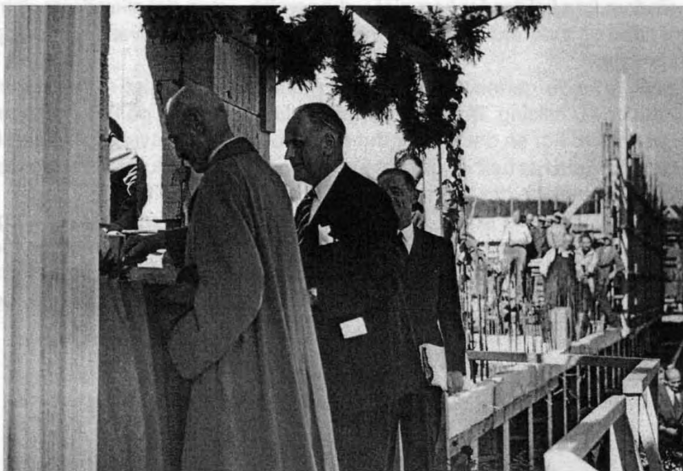
Grundstensnedlæggelse ved H. M. Kong Haakon VII 15. september 1953.