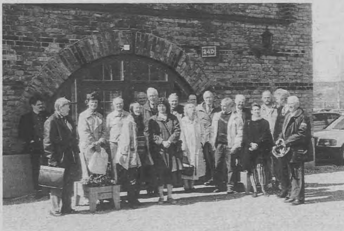
Deltagare vid NPH:s 16:e pappershistoriska konferens utanför bruksgården Ortvikens pappersbruk.

Utgiven av Föreningen Nordiska Pappershistoriker