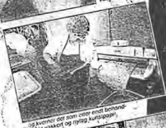
...og kvorner det som etter endt behandling blir vasket og ryttet kunstpapir.